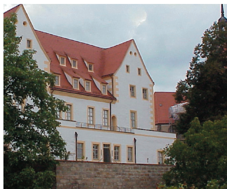
Beispiel gelungener Stadtentwicklung in Torgau – Stadt- und Stadtmuseum Kanzleihaus

Das Förderprogramm „VwV-Stadtentwicklung“ im Freistaat Sachsen geht inzwischen in sein viertes Jahr. Nach der erfolgreichen Halbzeitbewertung des Programms übernimmt das isw Institut weiterhin die wissenschaftliche Begleitung und laufende Evaluierung.